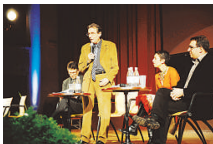
Roland Ries a promis de donner des débouchés concrets, dans les prochaines semaines, aux orientations qu'il a fixées à sa politique culturelle.

Le débat devra continuer, a martelé Roland Ries qui, sur la base de celui qui s'est engagé ces derniers mois, a tracé hier les trois grandes orientations de sa future poli-